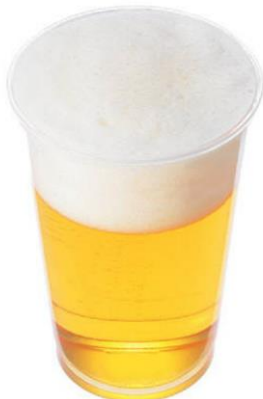
酒類はコップに注いだ状態での販売をお願いいたします