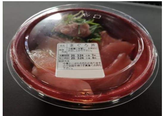
生食の露店営業は出来ません そうざい製造業としての販売をお願いします